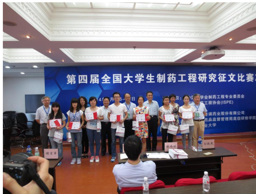
2014年第四届全国学生制药工程研究征文比赛决赛